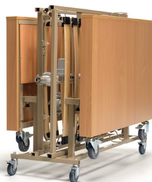
Livré sur Kit de transport