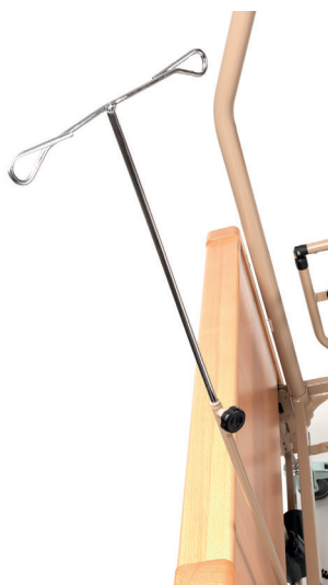
Porte serum (en option)