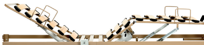
Lattes en bois