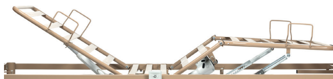
Lattes en métal