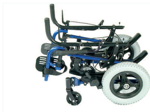
facile à plier pour le transport