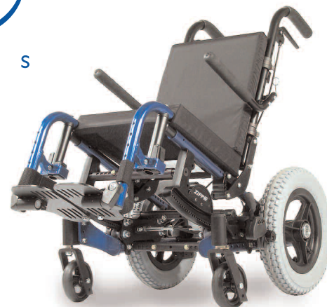
court, petit, léger - simple à basculer