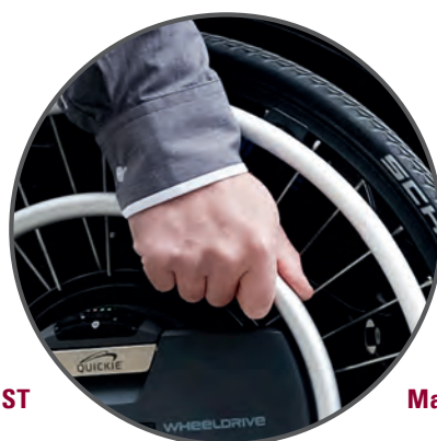
Main courante DRIVE