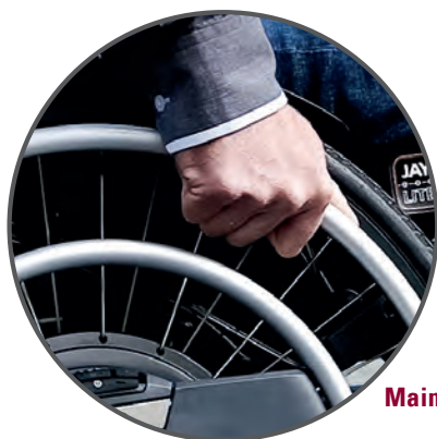
Main courante ASSIST