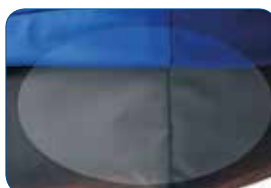
Matériau anti-dérapant sous le matelas