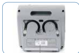
Numéro de traçabilité au dos du compresseur (n°série)