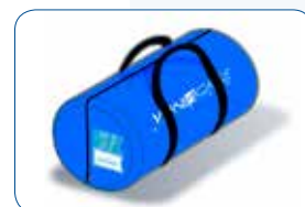
Sac de transport avec identification sur le devant du sac