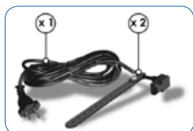
Nouveau câble avec 2 systèmes de fixation au sommier