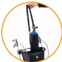
Panier avec support d'oxygène amovible**