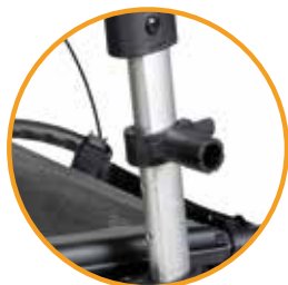
Dispositif de verrouillage universel