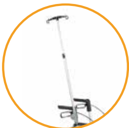
Support pour perfusion